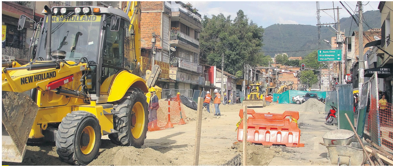
Entre las carreras 31 y 29 sobre Ayacucho el METRO avanza en los trabajos del tranvía.

EL METRO, CON SU CONTRATISTA DE OBRA, INICIÓ TRABAJOS recientemente entre las carreras 31 y 29 sobre Ayacucho.