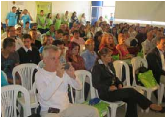
TV METRO 141. METRO Y UPB REALIZAN EL DIPLOMADO EN CULTURA METRO CON 100 LÍDERES