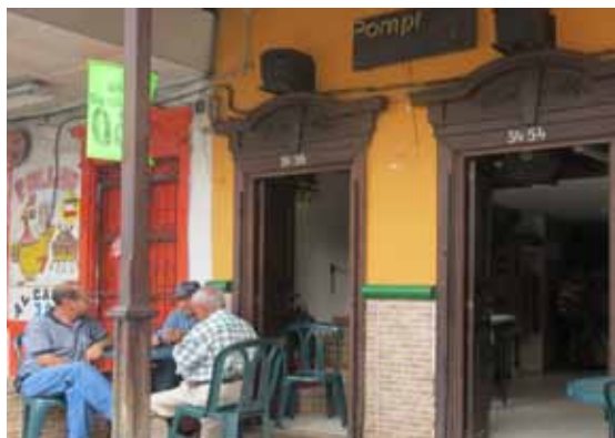
TV METRO 144. POMPI BAR ES UN LUGAR CON HISTORIA Y TRADICIÓN EN AYACUCHO