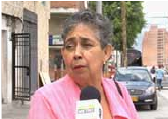
TV METRO 143. LAS PERSONAS YA COMENZARON A USAR Y APROVECHAR EL CORREDOR DEL TRANVÍA