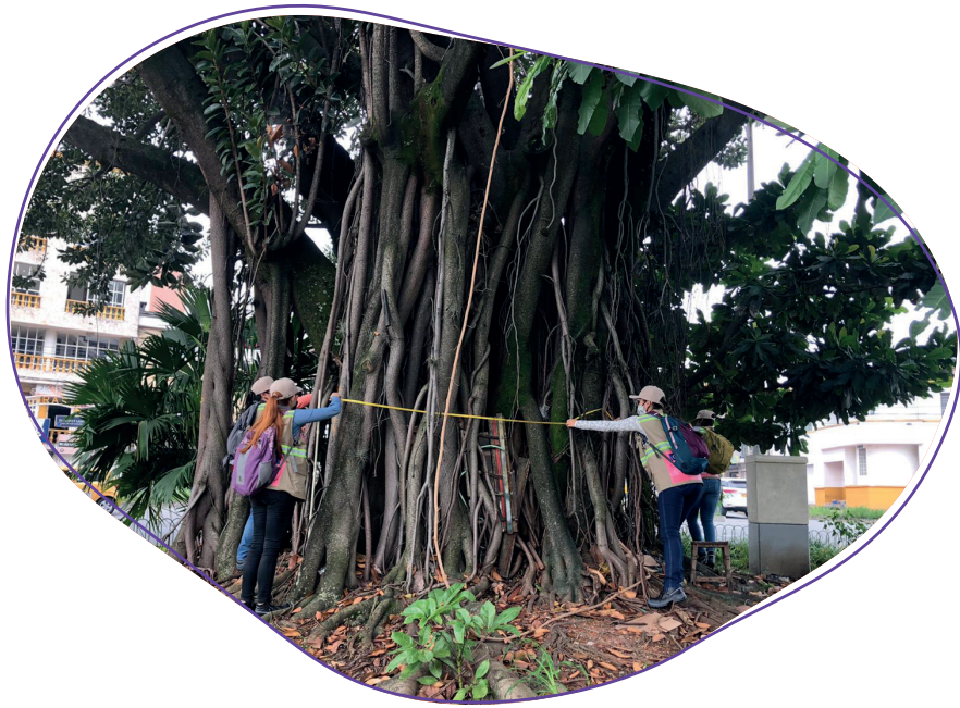
Imagen: este caucho, ubicado en el cruce de la calle 35 y la Avenida 80, es uno de los 8 árboles patrimoniales que preservará el proyecto.

El Metro de la 80 culminó el Estudio de Impacto Ambiental y Social para determinar los impactos positivos y negativos que podría generar el proyecto en sus diferentes etapas. Aunque el proyecto no requiere licencia ambiental, como parte de su relación positiva con el entorno, y considerando la importancia que tiene para la ciudad, se elaboró este instrumento bajo los lineamientos establecidos a nivel nacional para este tipo de estudios.