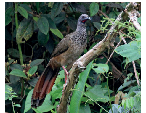
Imagen: La Guacharaca colombiana (Ortalis colombiana) es una de las especies endémicas identificadas en el área de influencia.

En el componente biótico se realizó una caracterización de los ecosistemas urbanos donde se va a construir el proyecto, partiendo de la vegetación y la interacción de esta flora con otros organismos vivos, como anfibios, reptiles, aves y mamíferos.