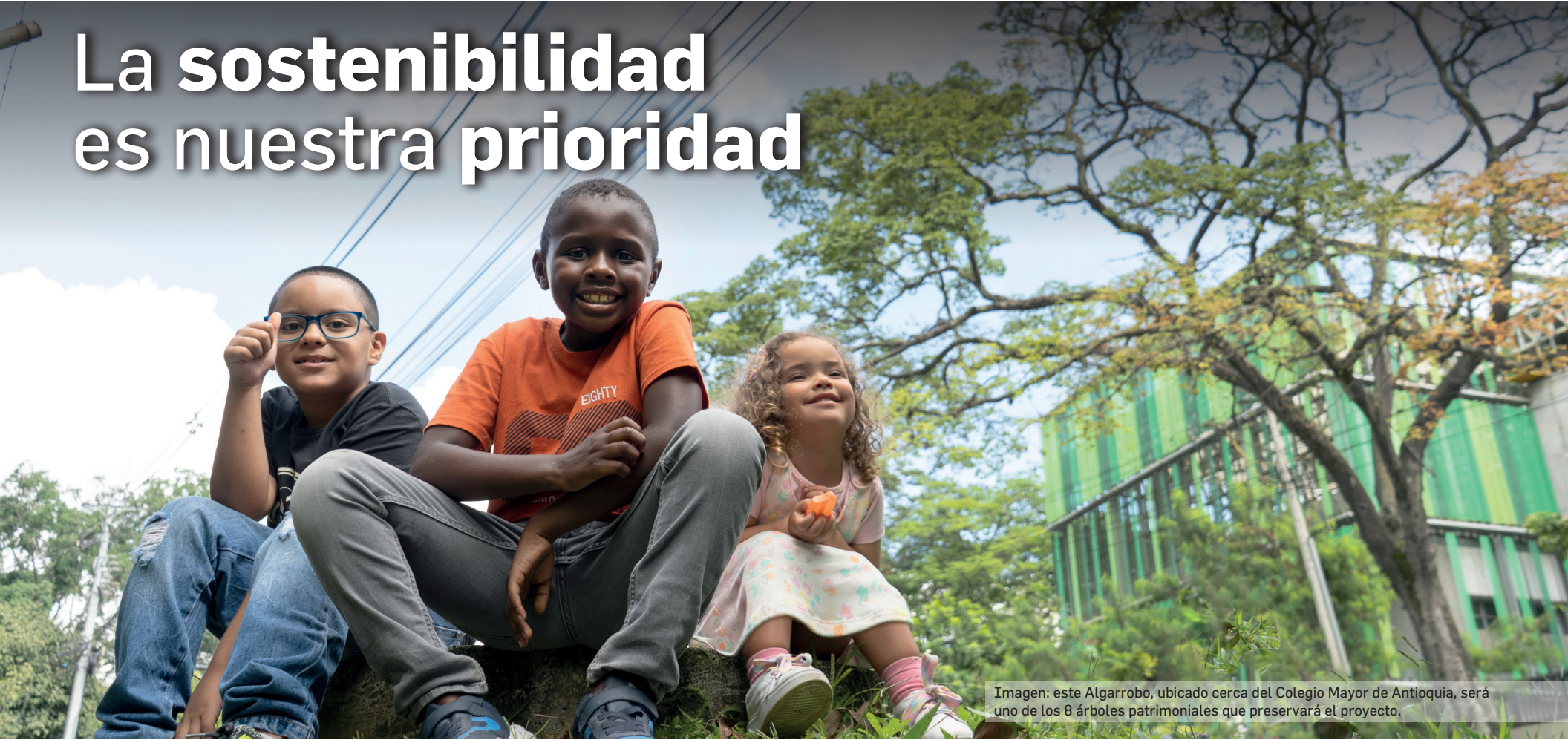
Imagen: este Algarrobo, ubicado cerca del Colegio Mayor de Antioquia, será uno de los 8 árboles patrimoniales que preservará el proyecto.

La ciudad está a punto de vivir una gran transformación. El proyecto Metro de la 80 llega para integrarnos y unir territorios, mejorando la calidad de vida de cerca de un millón de habitantes del occidente de la ciudad.