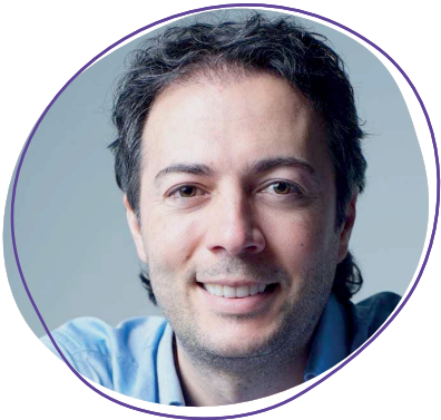
Daniel Quintero Calle Alcalde de Medellín

“Con el Metro de la 80 estamos construyendo Futuro, este megaproyecto mejorará la movilidad de los habitantes del norte y occidente de la ciudad. Los intercambios viales son la cuota inicial del Metro de la 80, un sueño que cada vez está más cerca”.