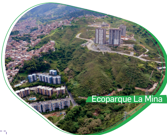
Ecoparque La Mina

Preservación del 64% de las especies inventariadas (8.909 individuos)