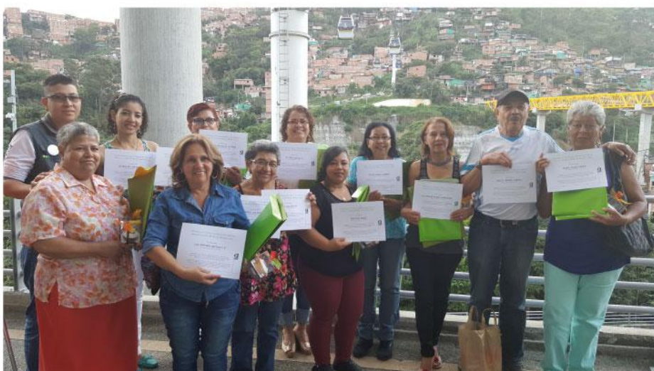
A los cursos de la Sala de Cómputo asisten personas de todas las edades.

Algunos de los cursos ofrecidos durante el año pasado en la Sala de Computo fueron sobre sistema operativo, Photoshop, Corel, Office, entre otros. La idea es que a partir de marzo del presente año se ofrezcan nuevos cursos para que las personas sigan aprendiendo y aprovechando la Sala de Cómputo del Metro.