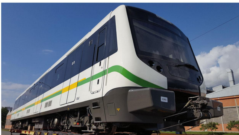
En los próximos días llegará a los patios de Bello otro tren más para ser puesto a punto.

Continúan arribando a la ciudad los trenes nuevos adquiridos por la Empresa a la compañía española CAF. Del total de 22 unidades compradas, ya cinco se encuentran en la ciudad, dos de ellas, las unidades 59 y 60, ya prestan servicio en la línea A.