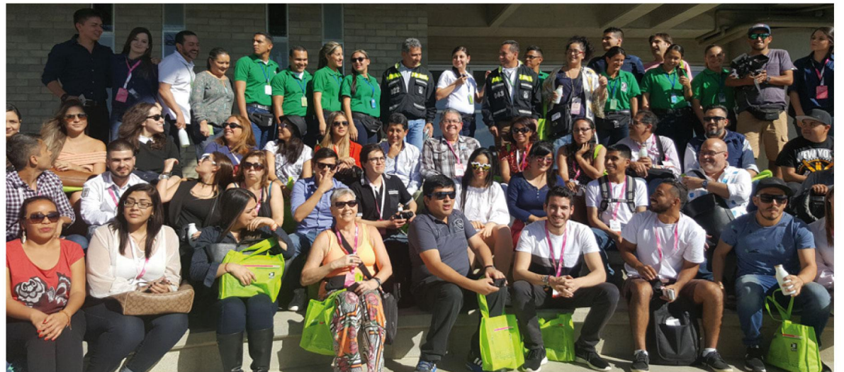
Los periodistas internacionales se mostraron sorprendidos con el sistema de transporte de la ciudad.

"Es una oportunidad de integración social y urbana maravillosa", fue la frase más repetida por ambas académicas.