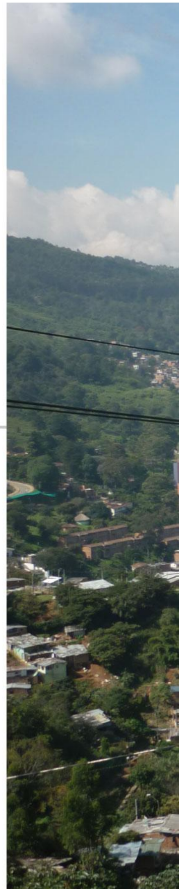
Panorámica de Medellín desde el

Desde el inicio de la operación comercial de Línea H, han ingresado más de 34.000 usuarios. Cerca de 12.000 usuarios ingresaron por la estación Las Torres y 22.000 por la estación Villa Sierra.