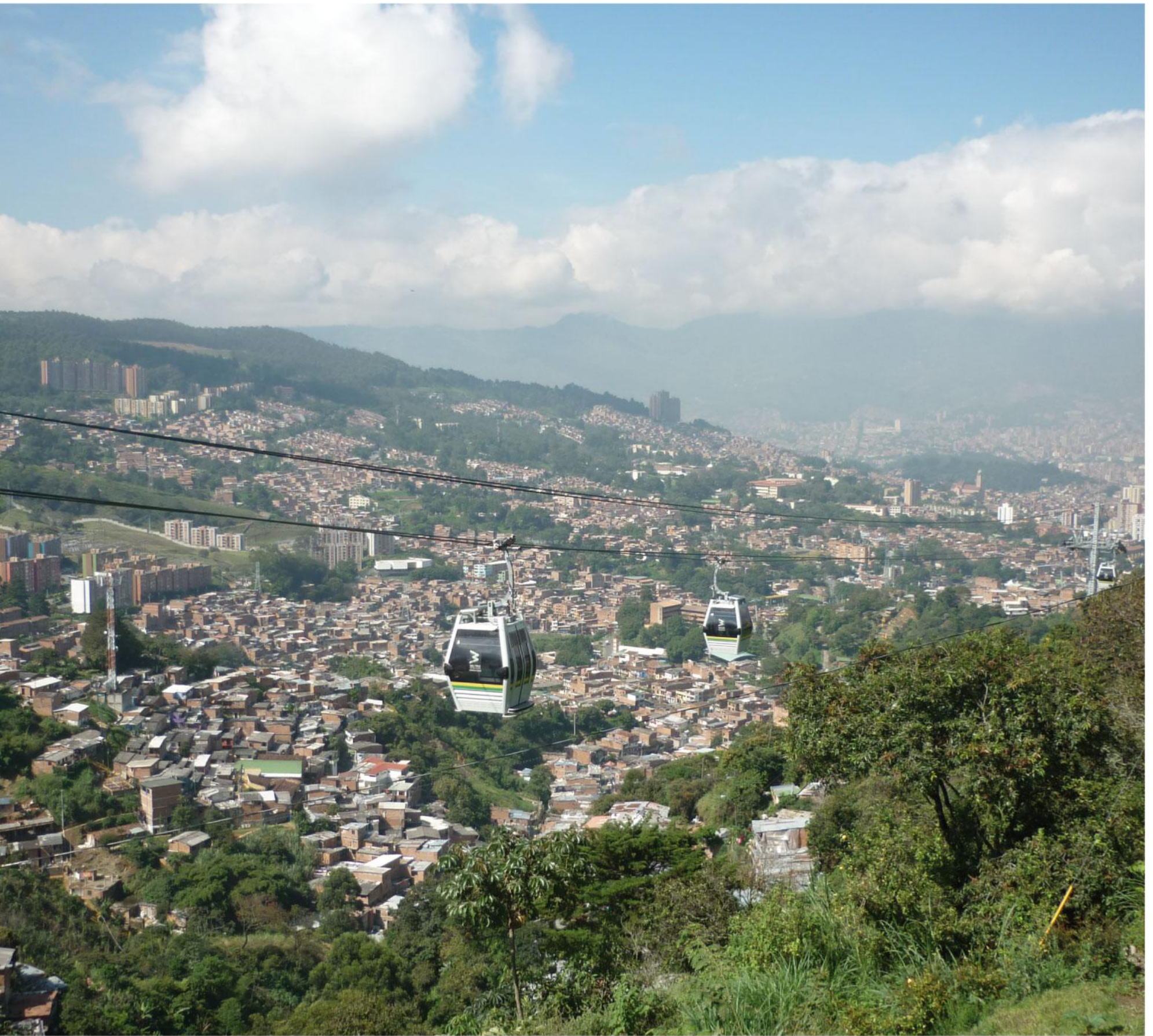
mirador de la estación Villa Sierra, la última del metrocable Línea H. Esta línea inició su operación comercial el 7 de diciembre.