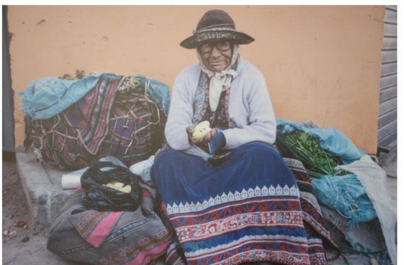
La abuela moderna. Autor: Coleen Legrix