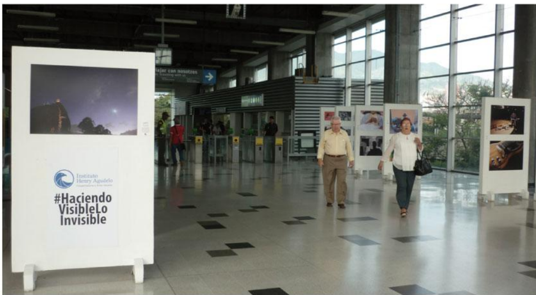
La exposición recogió las propuestas de los estudiantes de fotografía básica, avanzada, fotoperiodismo y revelado del Instituto Henry Agudelo.

Los estudiantes de los diferentes cursos del Instituto de fotografía Henry Agudelo expusieron por estos días sus trabajos en la estación Itagüí. La muestra se tituló Hacer visible lo invisible. Allí, los usuarios del sistema pudieron apreciar obras de diferentes temáticas como retratos, paisajes e instantes de la vida cotidiana de la ciudad. Una exposición que atrajo a muchos usuarios con su calidad artística.