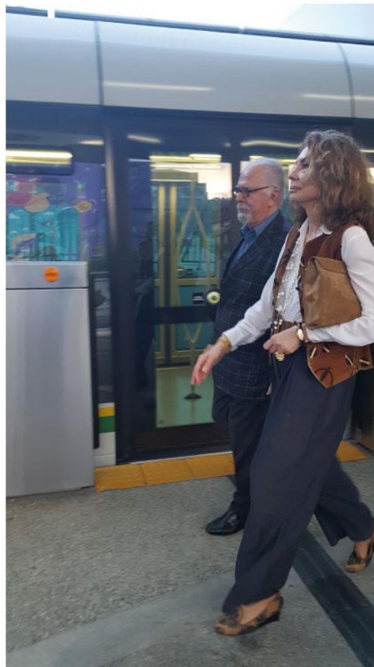
El Maestro, su esposa y sus acompañantes tomaron el tranvía en la estación San Antonio

Al final, una nueva sonrisa para quienes saludaron la presencia del artista en nuestro sistema y la despedida ante una nueva visita del Maestro Botero a su ciudad.