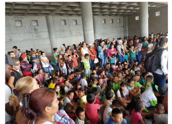
La comunidad se gozó con alegría la entrega de los kits.

La entrega de kits escolares estuvo antecedida por actividades culturales y recreativas. La convocatoria se hizo para los niños que pertenecen al programa Amigos Metro de cada uno de estos lugares y para los niños de la comunidad que quisieran asistir. Al final la respuesta fue masiva y cada niño se llevó para su casa un kit escolares el cual seguramente contribuirá para que se entusiasme a iniciar un año escolar de la mano de sus profesores, familiares y del metro, una empresa que llega a las comunidades para quedarse y ser un buen vecino.