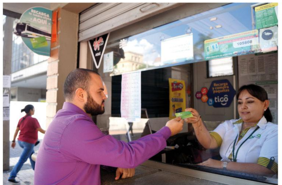
Ahora los usuarios tiene la opción de recargar la Cívica en los Gana de las estaciones de las línea A, B y J y en los sitios de venta Gana de Envigado y Sabaneta.

Para conocer la ubicación de todos los puntos ingrese a los sitios web www.civica.com.co y www.metrodemedellin.gov.co