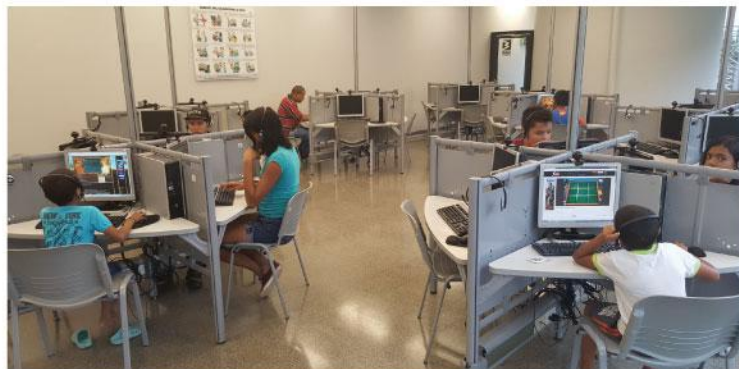
La Sala de Cómputo es un referente para todos los vecinos de la zona.

En la sala las personas aprenden, estudian, se divierten e interiorizan la Cultura Metro para vivirla no solo dentro del sistema sino en sus casas, instituciones educativas y barrio. Sala de Cómputo de Vallejuelos, un lugar para aprender y soñar con un mejor futuro.