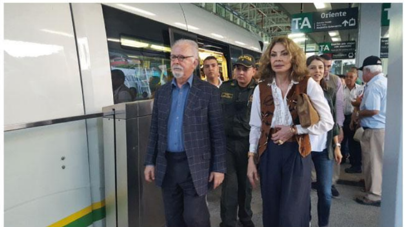
La visita del Maestro llamó la atención de decenas de curiosos que quisieron ver de cerca al artista y a su esposa.