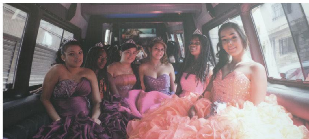
Cumpliendo sueños. Autor: Pablo Andrés Restrepo