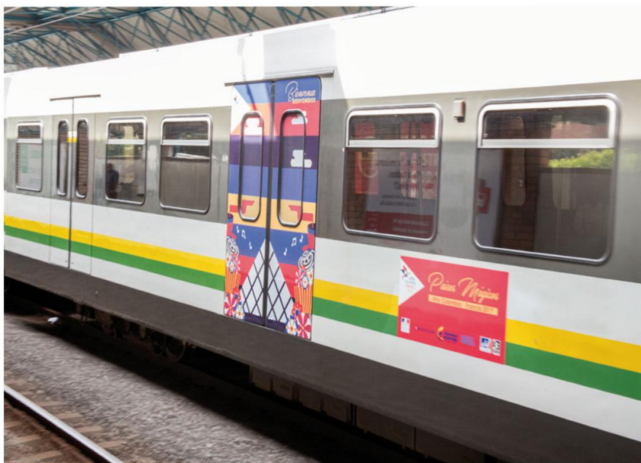
Arriba, el alcalde Federico Gutiérrez ingresa a la estación Poblado con el ministro de Relaciones Exteriores de Francia Jean Marc Ayrault. Abajo: imagen exterior del tren Colombia Francia.