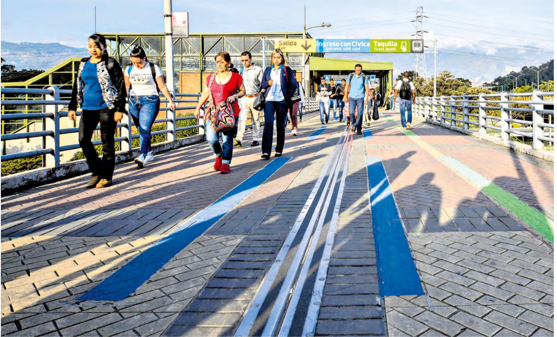
Así se ve hoy el acceso a la estación Industriales. Los viajeros ahora cuentan con más orden al ingresar y salir.

Un grupo interdisciplinario de profesionales se reúne de forma permanente para pensar cómo mejorar el orden, la seguridad, el ingreso y salida de viajeros en las estaciones de mayor concentración de personas como es el caso de Poblado, Industriales y Aguacatala.