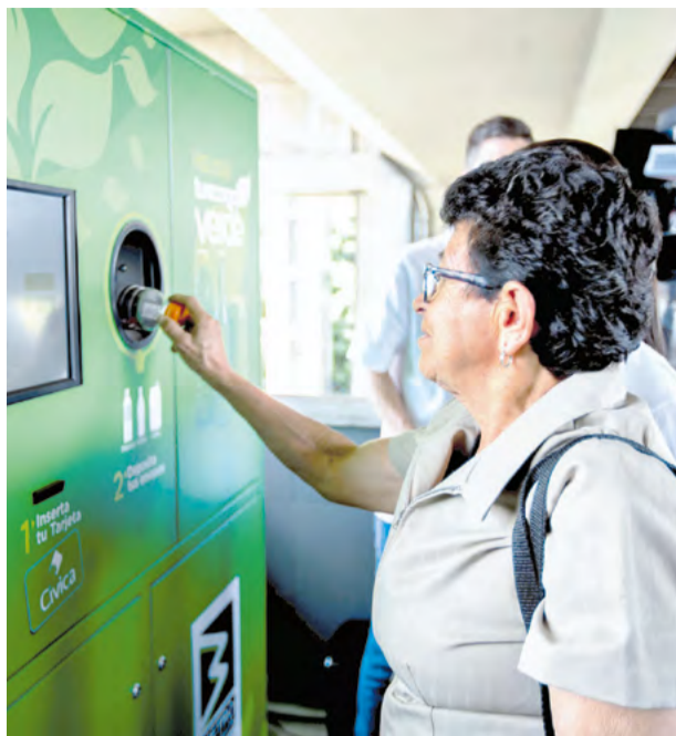
Durante 2018 el programa de Recarga Verde se expandió hasta tener cinco máquinas en todo el Sistema.

El proyecto de Recarga Verde cumple su primer año de operación oficial con la satisfacción del deber cumplido. La activación de los cinco puntos de recarga en las estaciones Universidad, Niquía, Santo Domingo, San Antonio e Itagüí durante este 2018 y la gran aceptación por parte de los viajeros, ratifican el éxito del proyecto.