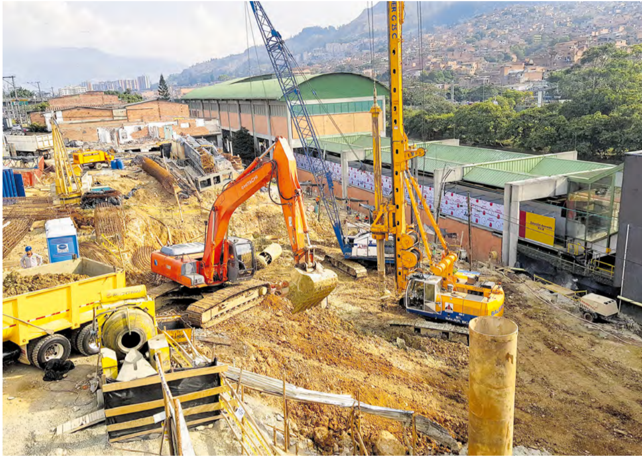
Acevedo es el frente más avanzado. Esta será la estación de integración de los metrocables K (Santo Domingo), P (Picacho) y de la línea A del Metro.

La comunidad está a la expectativa de la entrada en operación de este nuevo medio de transporte que mejorará la conectividad de la zona y traerá beneficios ambientales y más calidad de vida.