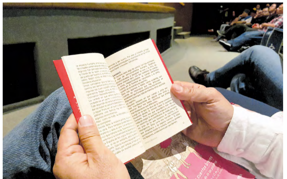
Este año se presentaron 10 títulos de Palabras Rodantes. Una importante contribución al fomento de la lectura en la ciudad.

Cada vez que se publica un libro, se hace una presentación y conversatorio. El último que se realizó, en torno a la Pensadora del aura de la autora española, María Zambra-