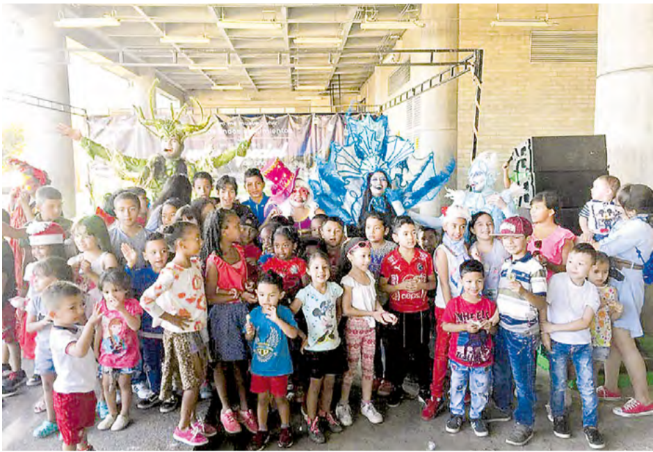
Los niños han acudido masivamente a estas celebraciones navideñas.

Con 22 eventos culturales, el Metro celebró la Navidad con sus vecinos en las plazoletas del Sistema y sitios cercanos. La respuesta de los vecinos, especialmente de los niños fue muy positiva, cada actividad contó con una asistencia muy nutrida donde hubo derroche de sonrisas, unión, agradecimiento y buenos deseos para el 2019.