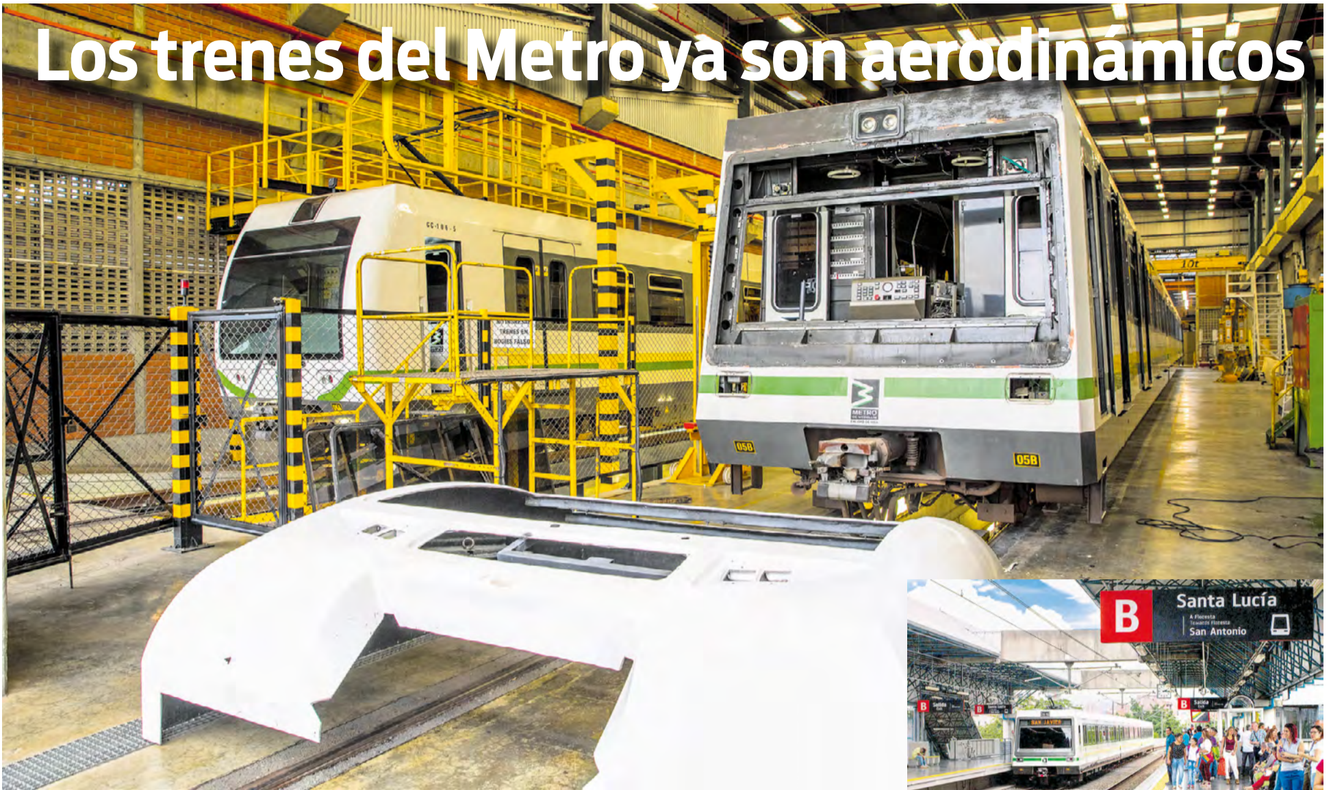
El proyecto de eficiencia energética consistió en cambiar el aspecto frontal de los trenes.