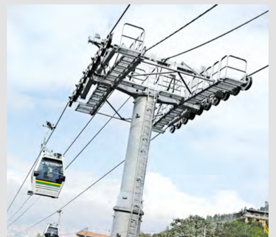
La tecnología del cable línea P será la misma que se usó para el cable de La Sierra (línea H).

Entre las ventajas de esta nueva tecnología se encuentran menores costos de mantenimiento y disminución del ruido. En conclusión, mayor aporte a la sostenibilidad. Este tipo de cable es el mismo instalado en línea H. Los primeros metrocables migrarán paulatinamente a esta tecnología.