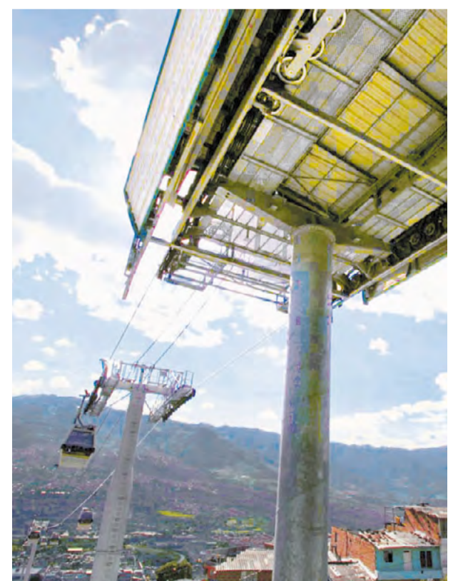
Los Metrocables han transformado la vida de sus vecinos al generar inclusión social.

"Los finalistas reflejan la creatividad y el ingenio impulsados por un movimiento global hacia las ciudades", publicó el WRI Ross Prize (Premios Ross del WRI), que serán entregados en Washington (EE.UU.) en abril del 2019. El ganador se llevará 250 mil dólares (unos 800 millones de pesos colombianos).