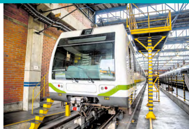
El proyecto se adelantó con la UPB y el apoyo de Colciencias.

La apariencia cuadrada de los 42 trenes de primera generación o MAN, ya solo se verá en las fotos o quedará en el recuerdo de los viajeros. Todo gracias a que esta semana se instaló el carenado aerodinámico del último de los trenes de la flota con que empezó a operar el Metro de Medellín en 1995.