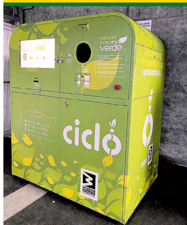
El proyecto de Recarga Verde obtuvo reconocimiento nacional y fue altamente valorado por los viajeros en 2018.