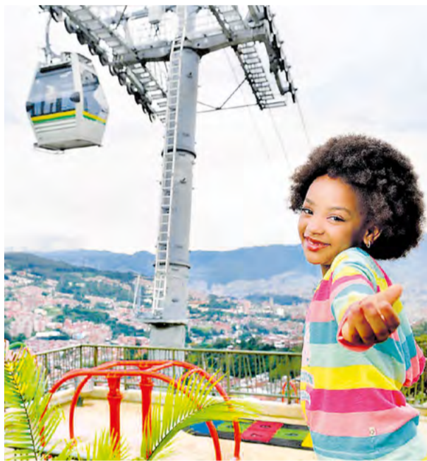
La organización del premio destacó los impactos positivos de la línea K.

Una excelente noticia para Medellín se dio a conocer recientemente y en esta ocasión, el Metrocable línea K es protagonista. Se trata de la nominación al Ross Prize, un reconocimiento internacional en el que Medellín competirá con otros cuatro proyectos de ciudades de India, Sudáfrica, Tanzania y Turquía.