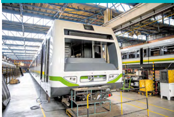
Se cambiaron en total 42 carenas de los trenes MAN.