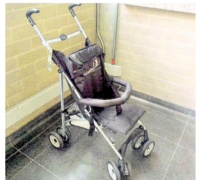
Los usuarios pueden acudir a los PAC o llamar a la línea Hola Metro para averiguar por sus pertenencias.