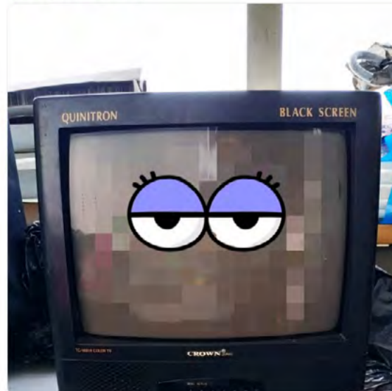
12:59 - 11 dic. 2018 desde Medellín, Colombia

Pudo alguien olvidar este televisor en uno de nuestros trenes, y tú no has podido olvidar a tu ex... 😞 (#CasosDeLaVidaReal: goo.gl/ASePVw )