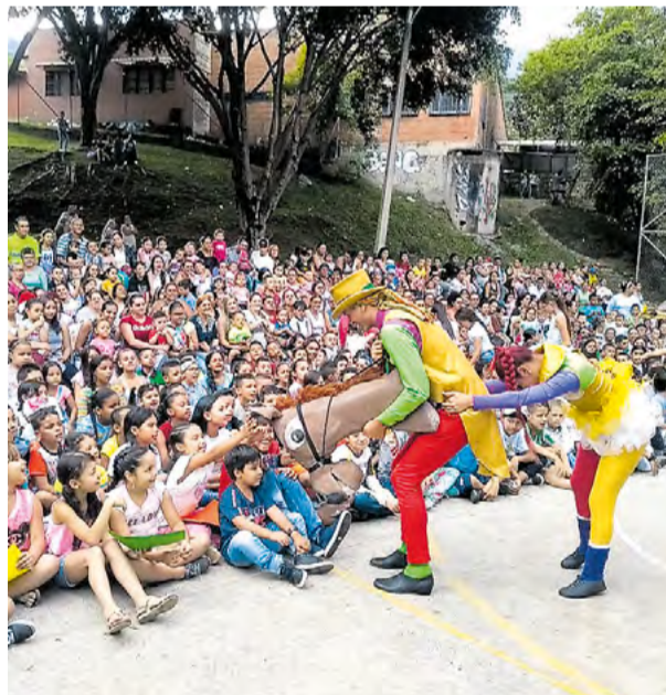
Cerca de 750 personas asistieron a la Navidad Comunitaria en el barrio El Progreso.

Igualmente, los días 17, 19 y 21 de diciembre se llevaron a cabo las navidades comunitarias en la Unidad Deportiva de Girardot, La Paralela, la biblioteca Gabriel García Márquez y la Unidad Deportiva El Progreso. Esta fue una oportunidad para integrar a las familias y compartir los sentimientos propios de esta época del año. Estos encuentros contaron con una masiva asistencia de los vecinos del futuro Metrocable Picacho. El proyecto también se vinculó a varias celebraciones navideñas de la zona.