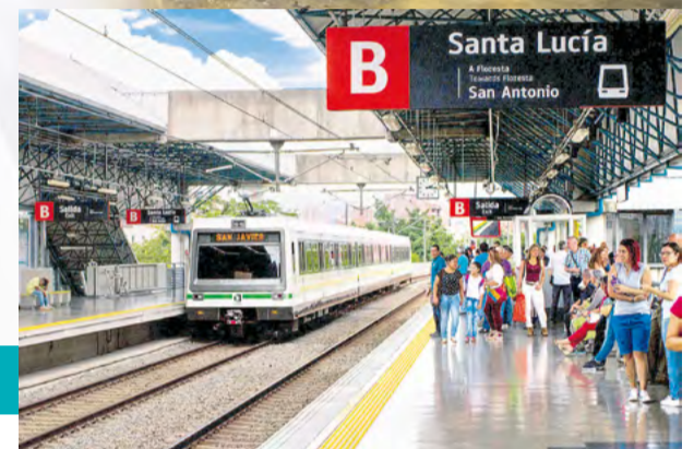
Así lucían los trenes de primera generación del Metro.