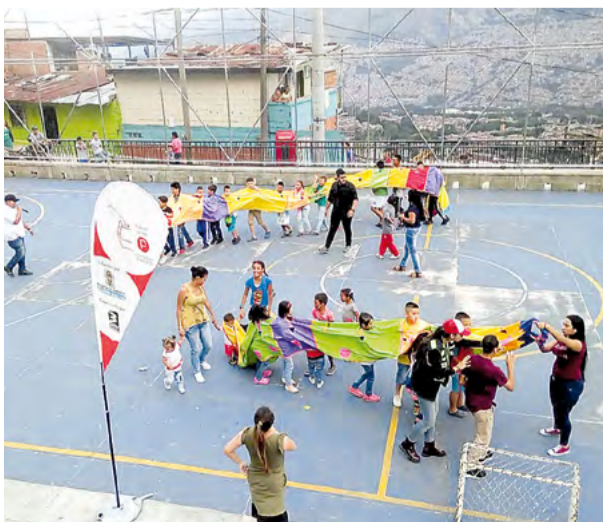
La diversión y el compartir estuvieron presentes en las Vacaciones Recreativas.