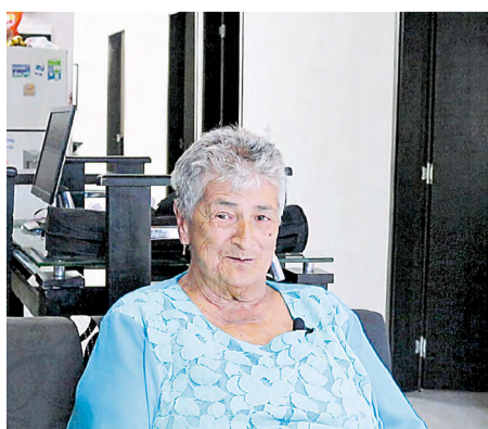
Cenobia contó con el acompañamiento de Isvimed y el Metro durante el proceso de reasentamiento.