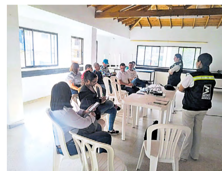
Reunión con el colectivo ambiental en la sede Las Brisas

Realizamos reunión con un colectivo ambiental de la comuna 5, en la sede social Las Brisas, donde se socializan los avances obra y la proyección que se tiene para el aprovechamiento forestal. ●