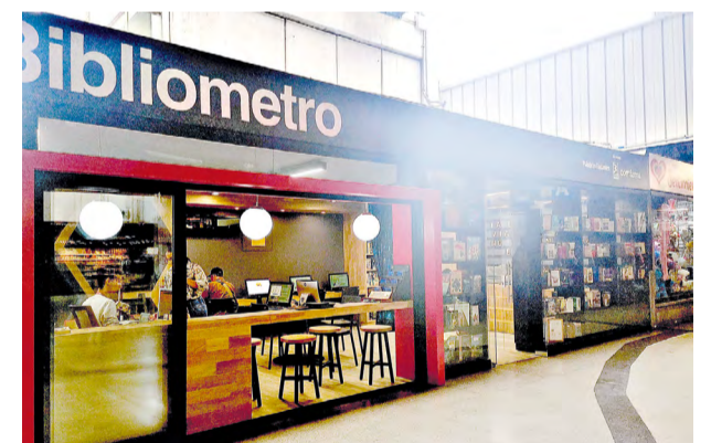
La Bibliometro se ha convertido en uno de los espacios más agradables de la estación San Antonio.

La bibliometro de San Antonio está abierta de lunes a viernes de 9:00 a.m. a 8:00 p.m. y los sábados de 9:00 a.m. a 5:00 p.m. •