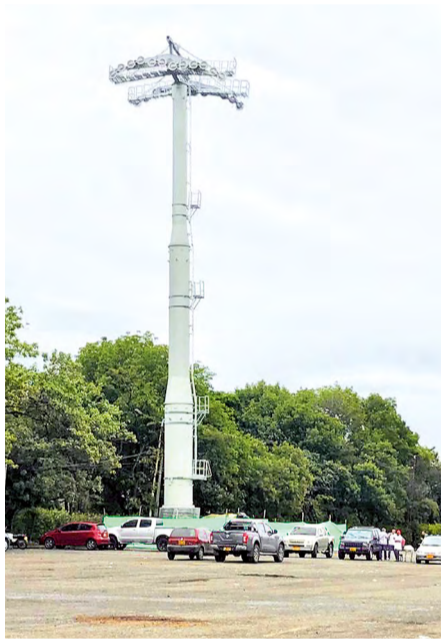
Imagen de la pylona 8, ubicada en la Feria de Ganados. Tiene 30 metros de altura.

Un aspecto del proyecto que vale la pena destacar es la generación directa de empleos. A comienzos del mes de abril, se han vinculado 652 personas a la obra, de las cuales el 67% corresponde a mano de obra no calificada.