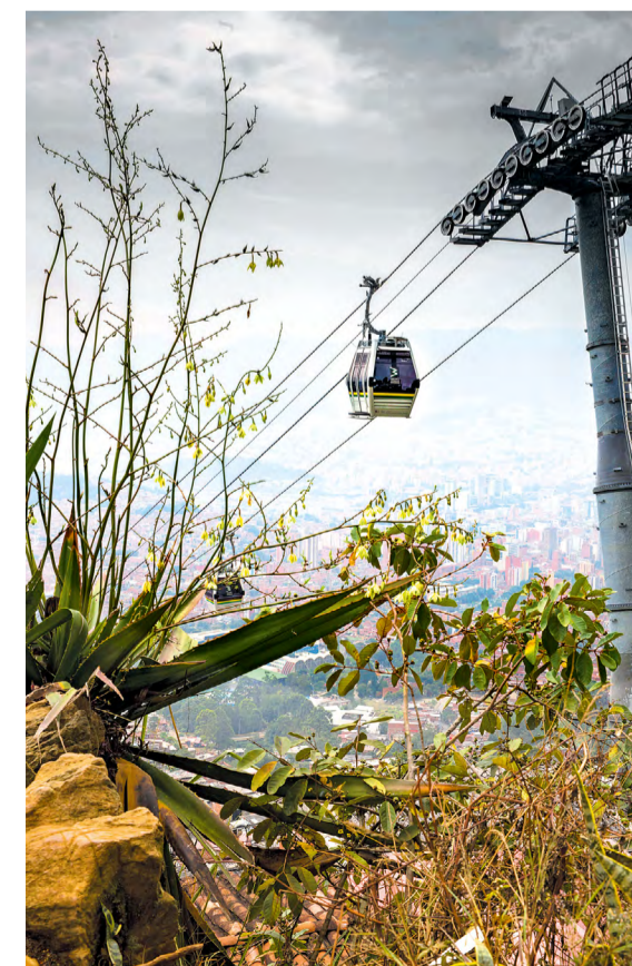
La línea M es el quinto Metrocable que opera en la ciudad.