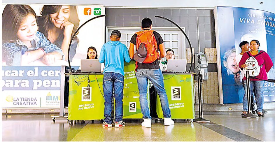
Los usuarios podrán conocer la ubicación de los puntos móviles a través de las redes sociales del Metro

La tarjeta Cívica es actualmente el medio de pago que le permite a los usuarios usar nuestro sistema Metro y disfrutar las tarifas de integración al pasar de un medio de transporte a otro.