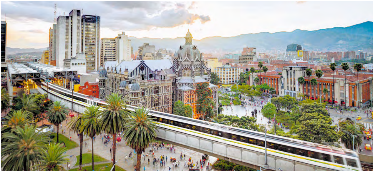
La Contraloría General de Medellín destacó la buena gestión fiscal del Metro en los últimos años.

La Contraloría General de Medellín, a través de la Contraloría Auxiliar de Movilidad y Servicios de Transporte Público, realizó un comparativo de resultados de la gestión fiscal en los sistemas de movilidad masivos entre Bogotá, Medellín, Cali y Cartagena durante el periodo comprendido entre los años 2014 y 2018.