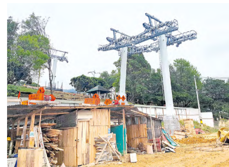
Imagen de las tres pilonas en la estación Sena