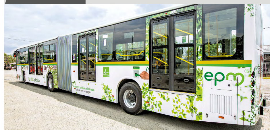
La operación del bus eléctrico dejó un balance positivo durante su prueba piloto

*Externalidad: Valoración económica de los impactos positivos y negativos que la actividad de una empresa genera sobre los habitantes de un territorio, sin importar si estos usan o no sus productos y servicios.