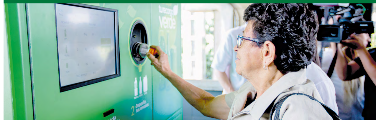
El programa Recarga Verde se consolidó con cinco puntos.