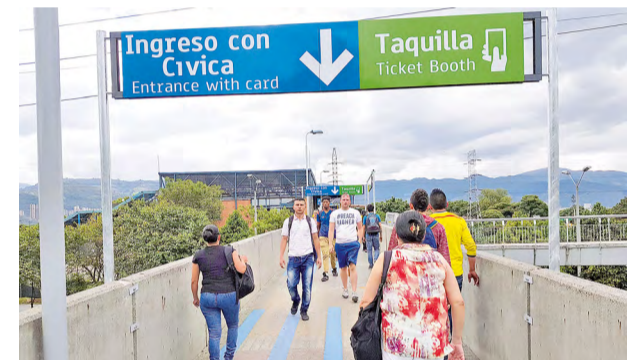
Los cambios han tenido buenos resultados, como se evidencia en la estación Poblado.

El Metro recomienda para agilizar el paso a la estación, mantener recargada la tarjeta Cívica. •