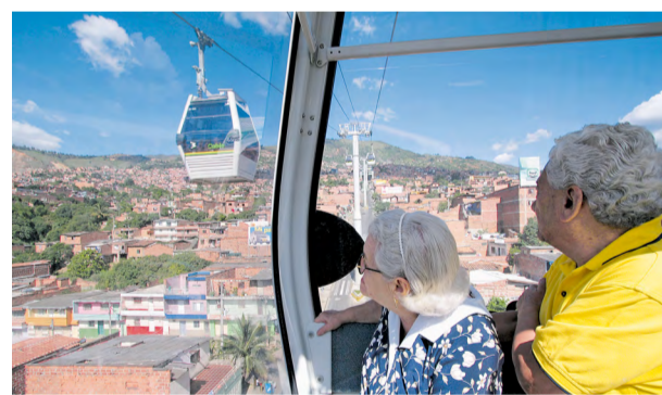
La línea K se convirtió en un emblema de la ciudad y su espíritu innovador.

La línea K, el Metrocable que va de Acevedo a Santo Domingo, alcanzó el pasado miércoles 3 de abril las 100 mil horas de operación desde su inauguración el 7 de agosto de 2004, siendo el primer sistema del mundo en alcanzar ese tiempo de servicio bajo estándares internacionales.