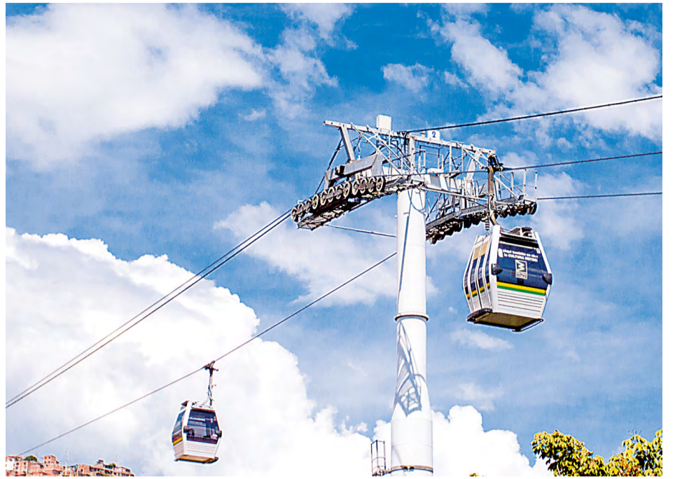
Este año, la línea J será la primera en cumplir con el mantenimiento anual.

Cada año la Empresa realiza el mantenimiento mayor de los sistemas de cables aéreos que operan en la ciudad. Estas actividades, necesarias para garantizar el adecuado funcionamiento de estas instalaciones, implican la suspensión del servicio durante varios días por la magnitud e importancia de las intervenciones realizadas.