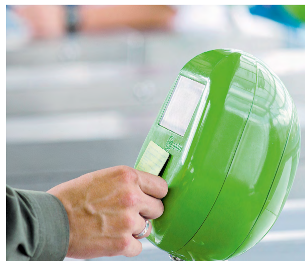
Los usuarios que tramitan su Cívica por Internet tienen varias estaciones como opción para recogerla.

do en la estación Parque Berrío, costado norte norte, el cual permanece abierto de lunes a viernes de 8:00 a.m. a 6:00 p.m. y los sábados de 9:00 a.m. a 4:00 p.m. El único requisito para reclamarla es presentar el documento de identidad.