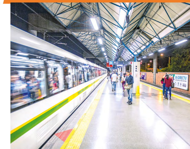
En 2018 el Sistema Metro movilizó cerca de 298 millones de usuarios