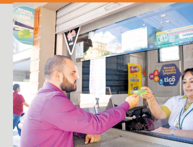
La red de recarga externa creció durante el año pasado.