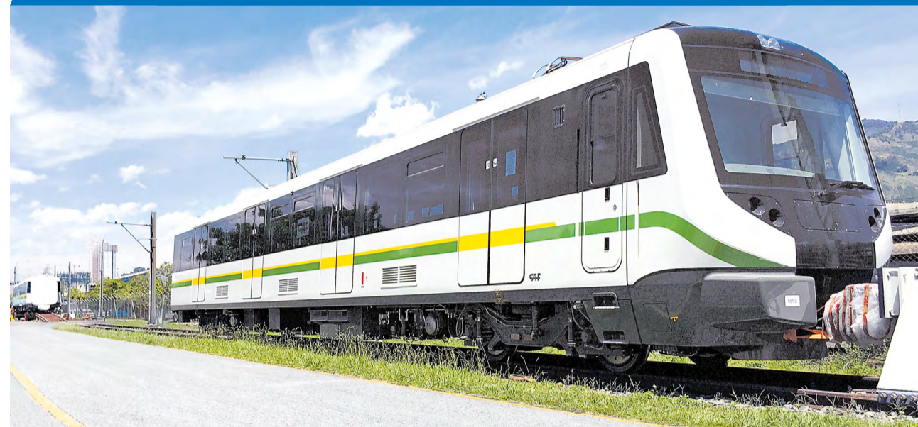
En 2018 se completó la llegada de los nuevos trenes adquiridos por la Empresa.