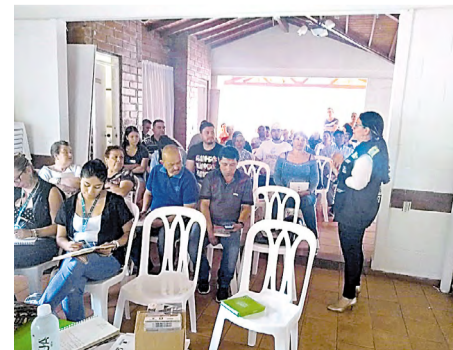
Reunión con comerciantes y comunidad en la sede social de Gratamira.