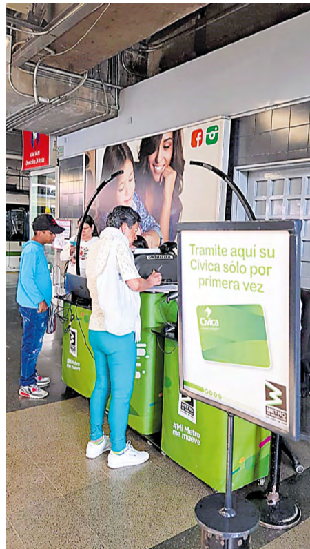
Con los puntos móviles se busca que más personas puedan tener su Cívica personalizada

Con los Puntos móviles Cívica seguiremos implementando estrategias que te permitan acceder y disfrutar de forma sencilla los beneficios de un sistema integrado de transporte. •