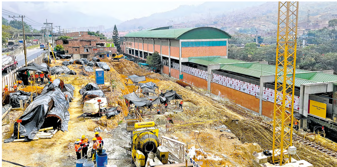
Trabajos en la estación Acevedo, desde donde partirá la futura línea P.

Continúan los avances de obra en la construcción de línea P. Para la primera semana de abril el proyecto alcanzaba el 52% de ejecución. Los trabajos se adelantan en cinco frentes: las estaciones (Acevedo, Sena, Doce de Octubre y El Progreso) y la instalación de las pilonas de la línea.