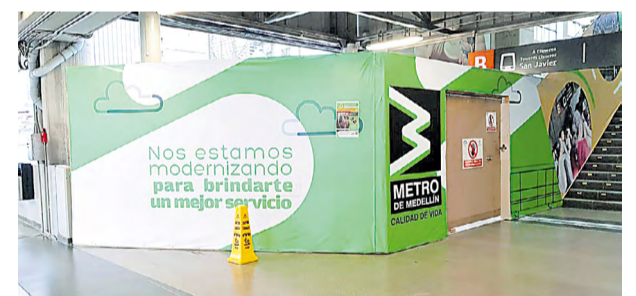
Muy pronto los usuarios de San Antonio estrenarán escaleras

El año pasado comenzó la renovación de algunas escaleras eléctrica en estaciones del sistema. El proyecto contemplaba el cambio de dos escaleras en la estación Parque Berrío, una en Hospital y dos en San Antonio. Las dos nuevas de Parque Berrío ya prestan servicio al igual que la de Hospital. Actualmente se trabaja en la instalación de dos nuevas escaleras de San Antonio, las que conectan las plataformas de las líneas A y B en el costado norte.