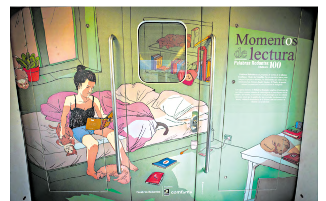
Imagen del interior del tren dedicado a Palabras Rodantes.

Con este tren el Metro y Comfama celebran la llegada al título 100 lo cual se traduce en 960 mil libros gratuitos que hoy pasan de mano en mano en el sistema y se encuentran en las bibliometro o dispensadores de lectura. •